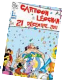
affiche édition 2011